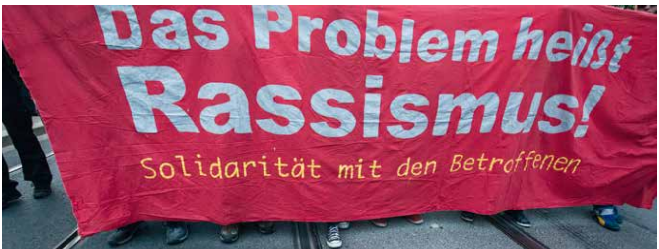
Am 17. Juni 2015 protestierten etwa 150 Menschen in Dresden auf einer Kundgebung des Bündnis Dresden Nazifrei. Der Protest richtete sich gegen einen Aufmarsch der NPD im Dresdner Stadtteil Leuben.

Im Mythos des gefährlichen Flüchtlings werden koloniale, rassistische und sexistische Denkmuster vermengt und Hetze gegen Geflüchtete betrieben. Gleichzeitig wird eine vermeintlich offene und nicht-patriarchale deutsche Mehrheitsgesellschaft konstruiert, die sich als aufgeklärt und »gut« imaginiert. Sexistische und rassistische Herrschafts- und Ausgrenzungsverhältnisse werden damit festgeschrieben. Eine Auseinandersetzung mit Gerüchten über sexualisierte Gewalt bzw. sexuellen Missbrauch muss sich daher immer beiden Ebenen widmen. Nachfolgend geben wir anhand der Diskussion von Fallgeschichten Empfehlungen, welche Reaktionen auf entsprechende Gerüchte sinnvoll und wirksam sein können. Grundsätzlich muss der Hetze gegen Flüchtlinge widersprochen und einer rechtsextremen Instrumentalisierung von Sexualstraftaten entgegengewirkt werden.