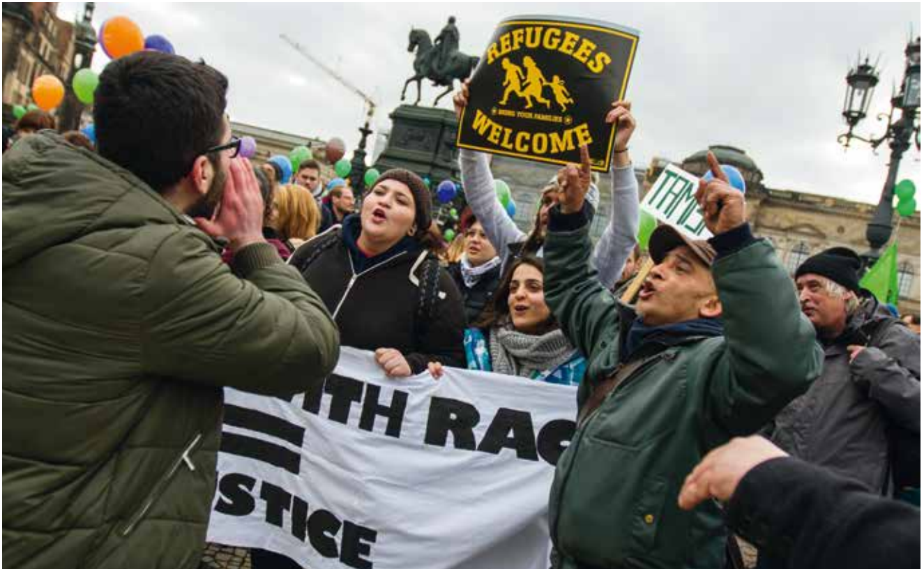
Etwa 4000 Menschen zogen am 28. Februar 2015 durch Dresden, um für mehr Rechte für und Solidarität mit Geflüchteten in Deutschland zu demonstrieren. Im Anschluss an die Demonstration entschlossen sich Geflüchtete und Unterstützende, einen Teil des Theaterplatzes zu besetzen, um so ihren Forderungen Nachdruck zu verleihen.

Der Fall zeigt zweierlei: Rassistische Zuschreibungen werden auch von der Polizei verwandt und von Medien aufgegriffen und weiter verbreitet. Im dargestellten Fall taugt die ethnisch konstruierte Gruppe kaum als Fahndungsbeschreibung. Es bleibt offen, welchen Informationsgehalt und Belastbarkeit Formulierungen wie »vom Typ her Nordafrikaner« besitzen. Denn welche Merkmale haben Menschen von Marokko über Tunesien bis zum Sudan gemeinsam? Wenn Verbrechen einem »Typ Nordafrikaner« angelastet werden, dann trägt diese Pauschalisierung dazu bei, bestehende Ressentiments, Rassismus und den Hass auf Flüchtlinge zu bestärken. Notwendig ist vielmehr eine Sensibilisierung für diesen Rassismus und eine Reflektion darüber, wie eigenes Handeln durch Stereotypisierungen beeinflusst wird. Es ist hilfreich, Beamt_innen in ihren sozialen, kommunikativen und interkulturellen Kompetenzen zu stärken.