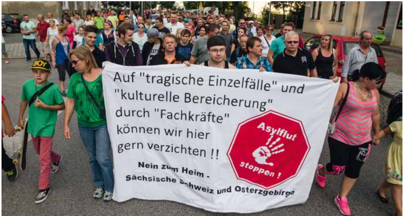
Am 21. August 2015 marschierten in Heidenau über 1000 Rassist_innen und Neonazis, um gegen die Ankunft von 250 Flüchtlingen zu protestieren, die in einem ehemaligen Baumarkt untergebracht wurden. Im Anschluss kam es zu schweren Ausschreitungen. Die Codes »tragische Einzelfälle« und »kulturelle Bereicherung« spielen auf eine vermeintlich höhere Kriminalität von Asylsuchenden an.