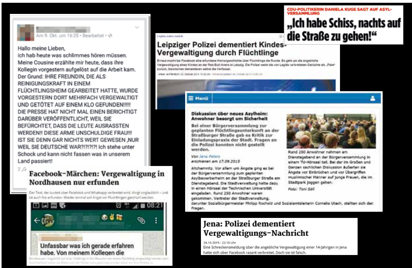
Die Screenshots aus Online-Medien und Sozialen Netzwerken zeigen, wie Gerüchte in Umlauf gebracht und Ängste transportiert werden.

In einer Kleinstadt in Mecklenburg-Vorpommern wird bereits vor der Eröffnung eines Flüchtlingsheims von Seiten der NPD gegen die Flüchtlinge gehetzt. Es existiert eine aktive rechtsextreme Szene in der Stadt. Wenige Tage nach der Eröffnung meldet sich ein Mann beim Bürgermeister der Stadt und behauptet, dass seine 20-jährige Tochter und Mutter eines Kleinkindes von mehreren »schwarzen Männern« angegriffen und vom Fahrrad gezerrt worden sei. Der Mann gehört der lokalen Nazi-Szene an. Auch mehrere andere Einwohner beschwerten sich mit dieser Geschichte bei der Stadt. Der Bürgermeister will die Sorgen der Leute ernst nehmen und erzählt die Geschichte im Gemeinwesen weiter. Abgesehen von einschlägigen Nazi-Seiten im Internet wird der »Fall« nicht in der Presse und durch die Polizei veröffentlicht. Ohne dass jemals geklärt werden kann, was stattgefunden hat, macht die Geschichte in der Folgezeit die Runde und wird in sozialen Medien wiederholt angeführt.